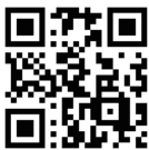
香港智能櫃櫃位資訊

(3)據點：順便智能櫃遍佈香港、九龍、新界的各大商場及工商大廈等。櫃位資訊請掃QR Code 參考。