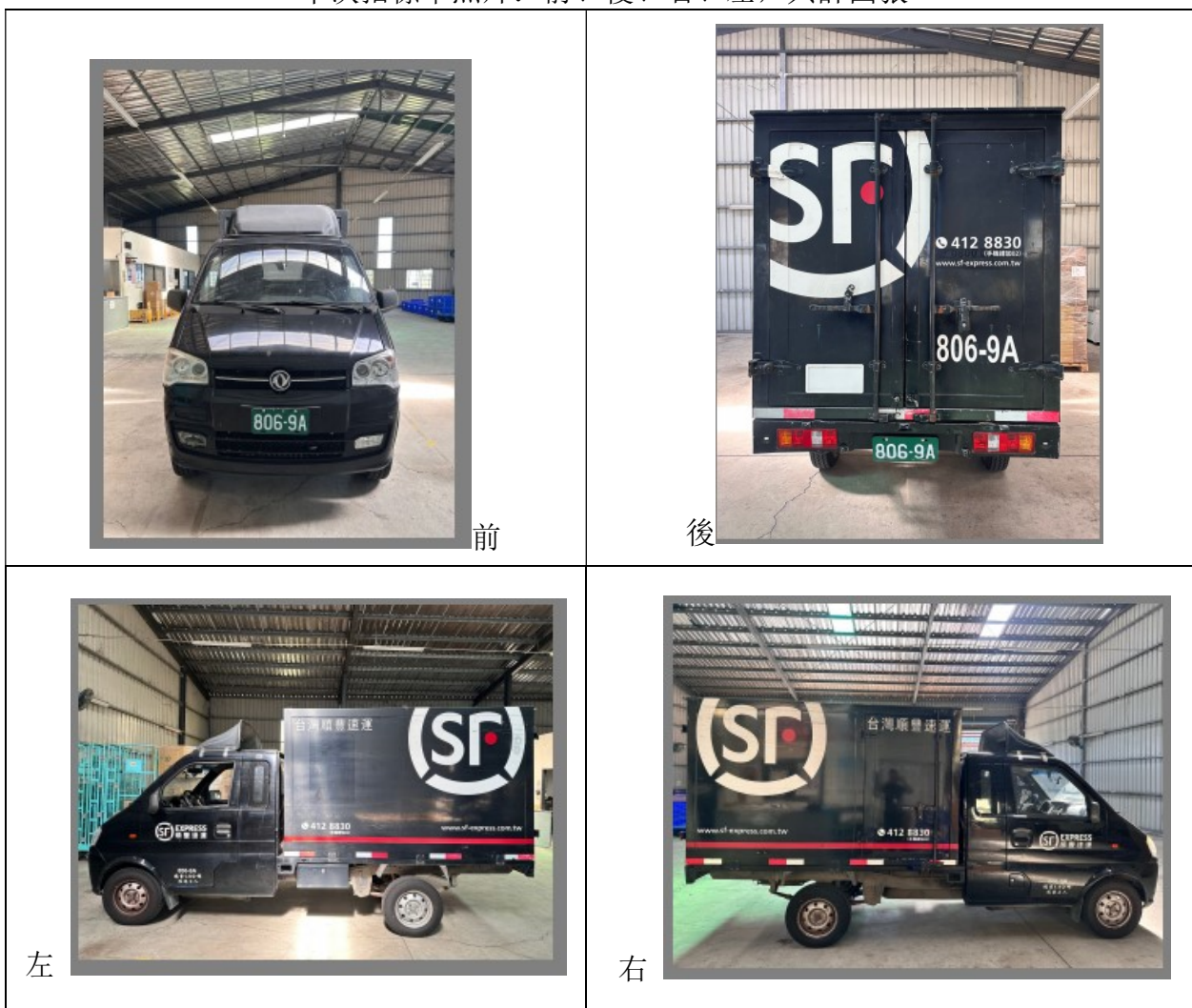
本次招標車照片：前、後、右、左，共計四張